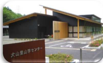
里山学センター外観