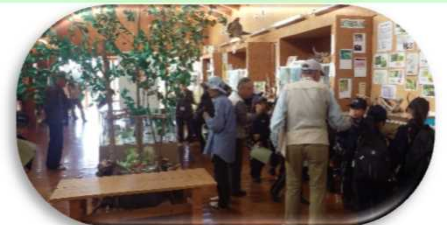
南山小里山体験学習支援