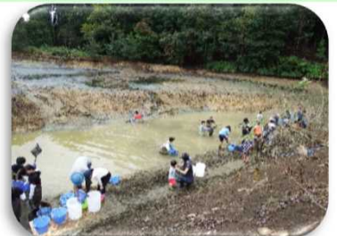
橋爪池おさかなレスキュー