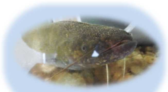
57年ぶりに見つかった新種「タニガワナマス」 里山学センターで展示

犬山市周辺の里山に対する、調査研究を踏まえ、自然資料の収集、および分析、環境学習並びに観察、保全に関する事業を行い、里山の利活用を図った。また、それら事業を担う人材の育成および交流の促進に寄与することを目的とし、事業を実施した。